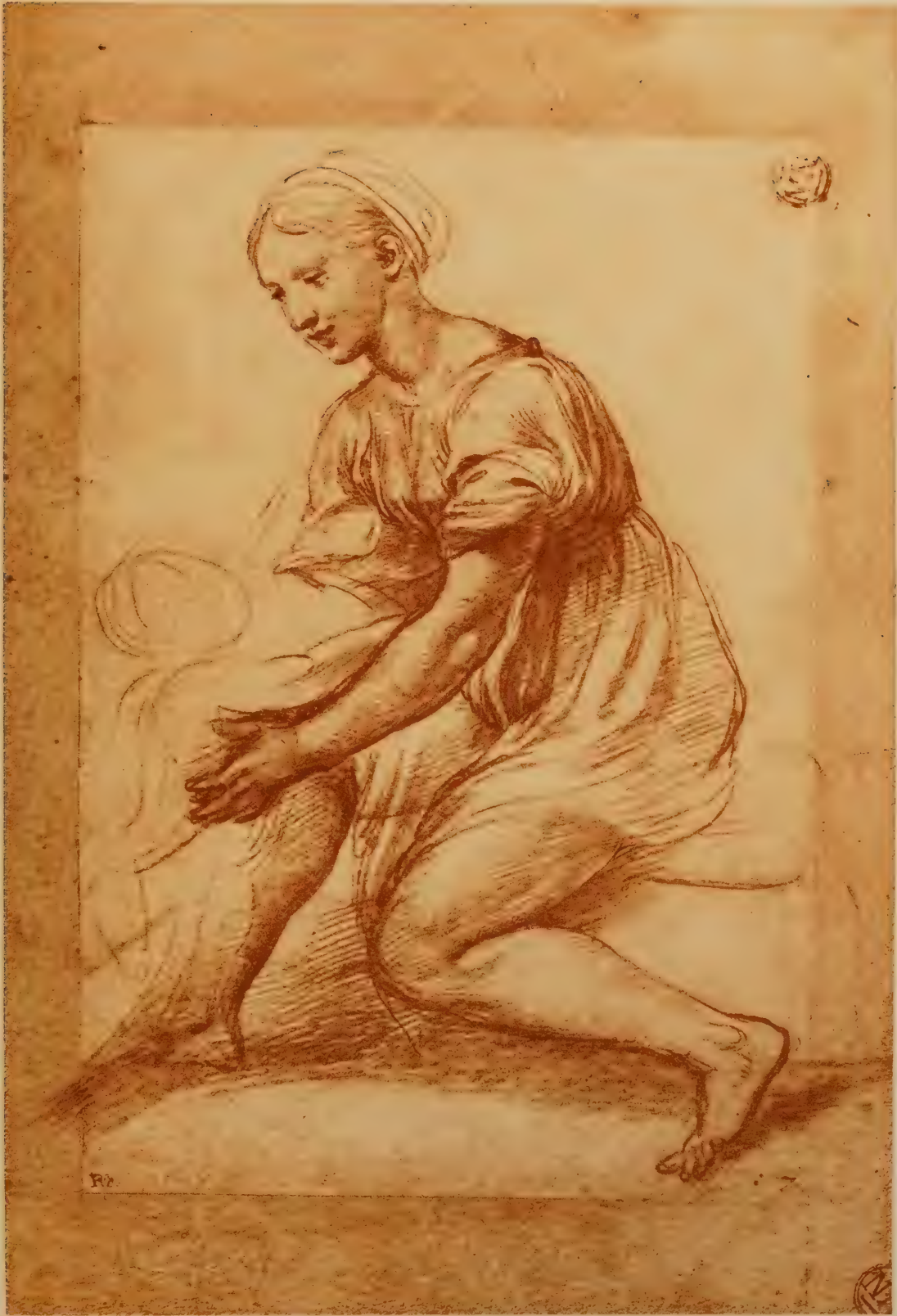
Etude pour la Vierge de François I er